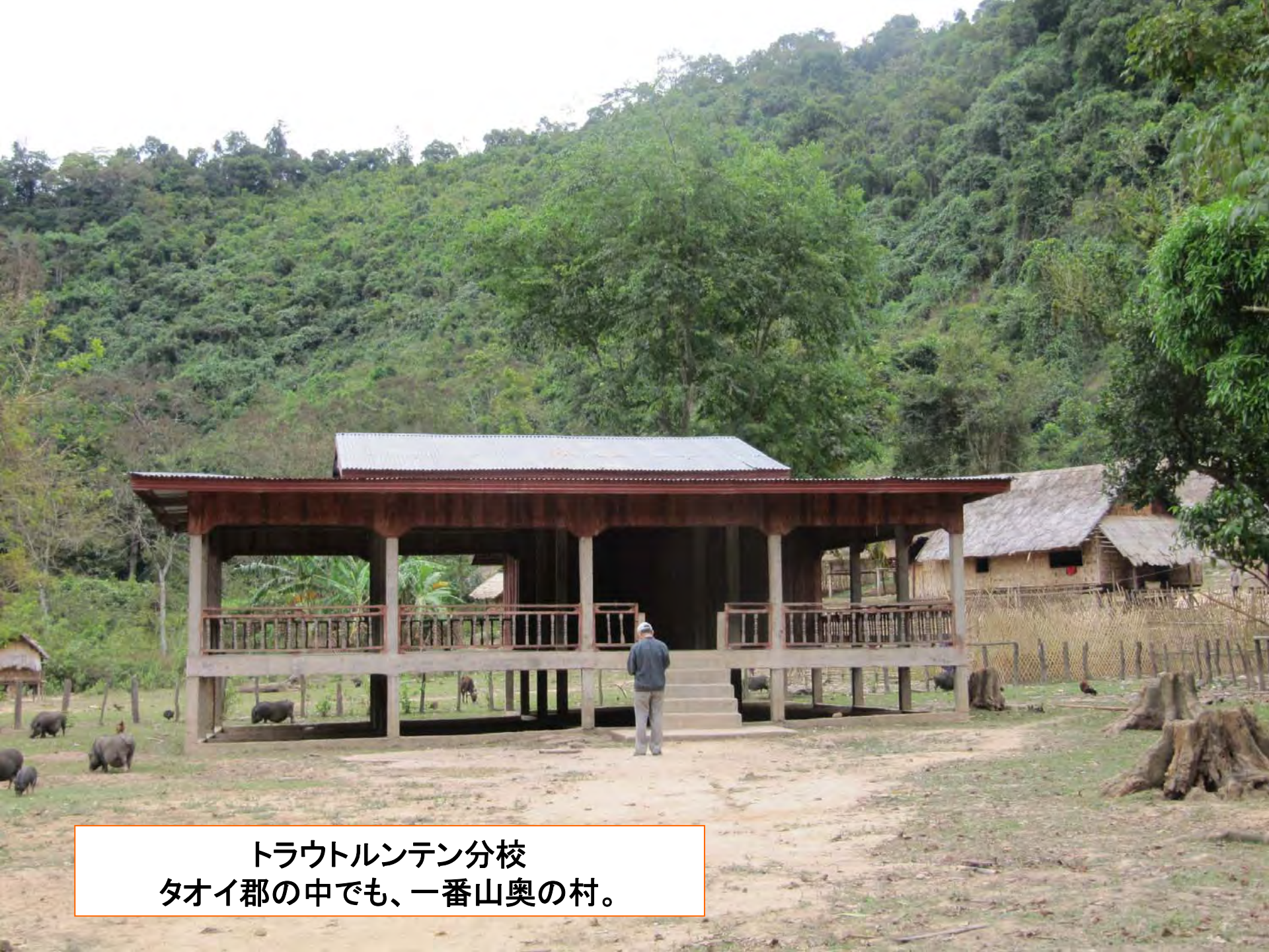
トラウトルンテン分校 タオイ郡の中でも、一番山奥の村。