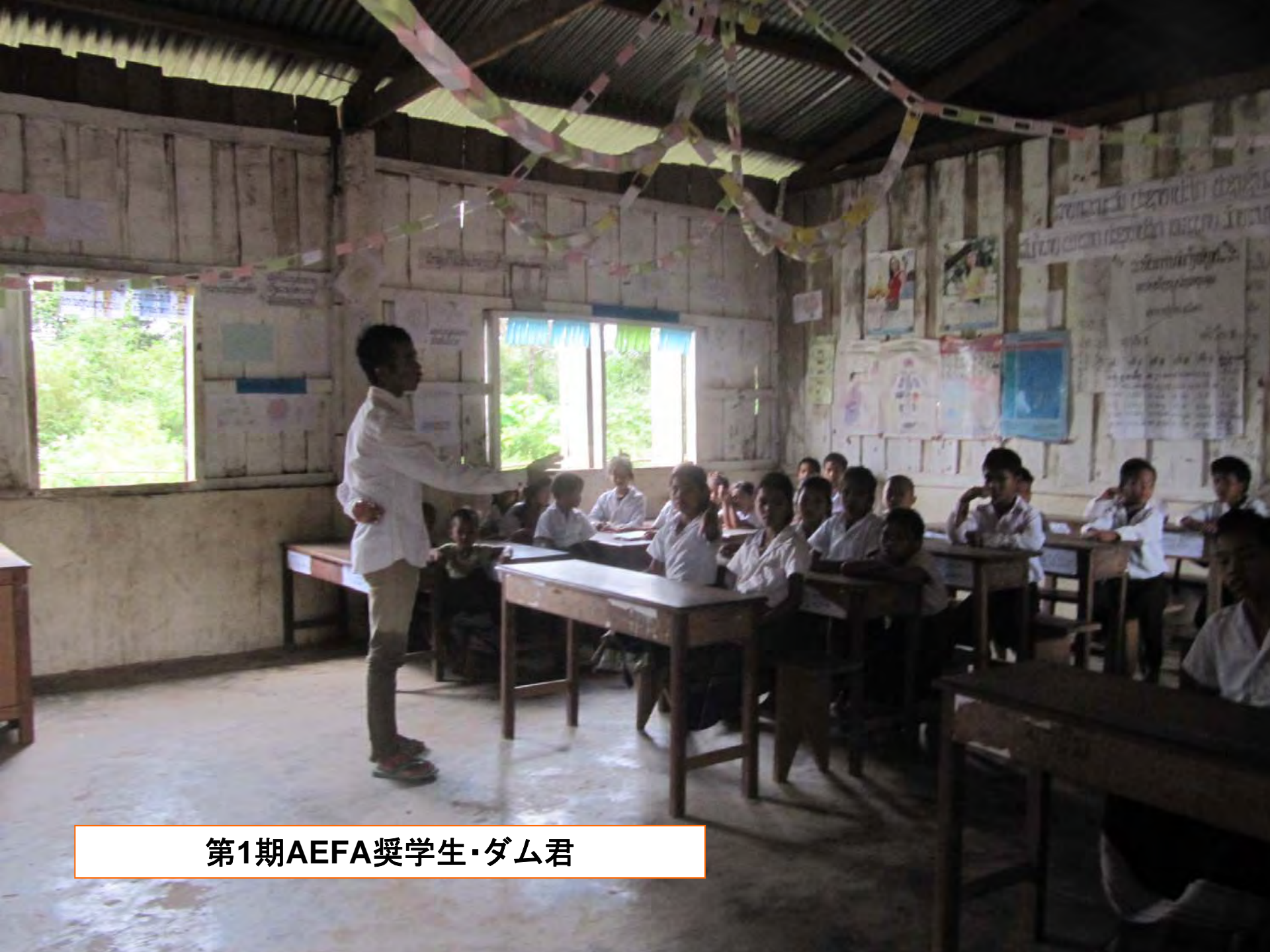
第1期AEFA奨学生・ダム君